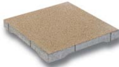
Dreen®Platte 500 x 500 x 60 mm