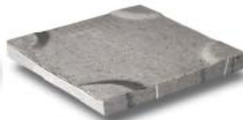
Dreen®Platte 500 x 500 x 60 mm