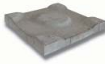
Dreen®Platte 300 x 300 x 45 mm