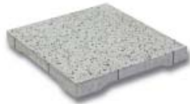
Dreen®Platte 300 x 300 x 45 mm

>> HOCHWERTIGES DACHTERRASSENBELAGSYSTEM